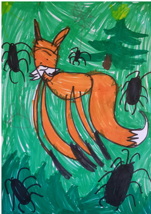
ZAUGG LAURA KINDERGARTEN 1

Eine Kinderfrage bleibt jedoch vorerst unbeantwortet: «Isch Afrika e Insle?» Nun ja, drumherum ist das Meer. England ist ja auch eine Insel. Aber Afrika... wissen Sie's?